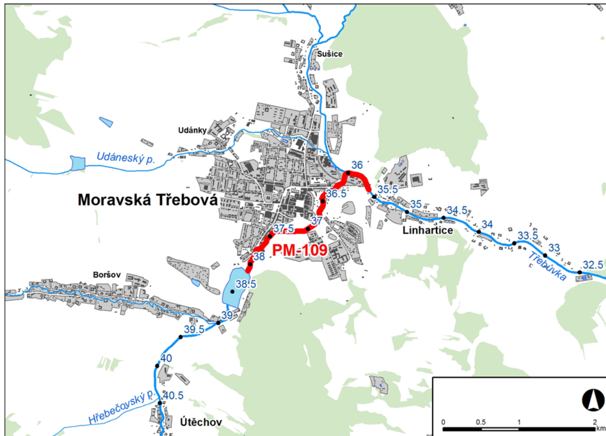
Obr. č. 1 Přehledná mapa řešeného území

Předmětem řešeného území je úsek na řece Třebůvce v km 35,625 - 38,093